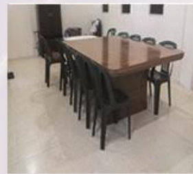
Bilik Kegiatan Pelajar