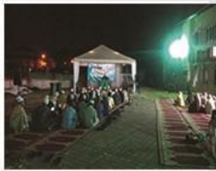
Dataran Ilmu KUIZM